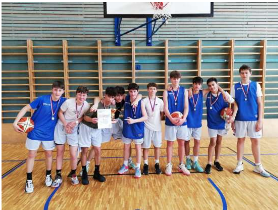
Košíková st. žáků – 1. ZŠ Rakovník – duben 2024