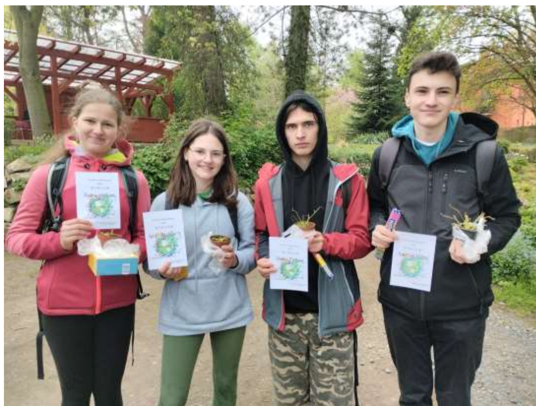
Ekologická soutěž – duben 2024