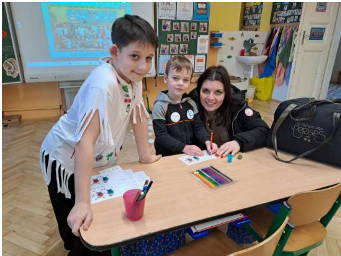
Den otevřených dveří – březen 2024