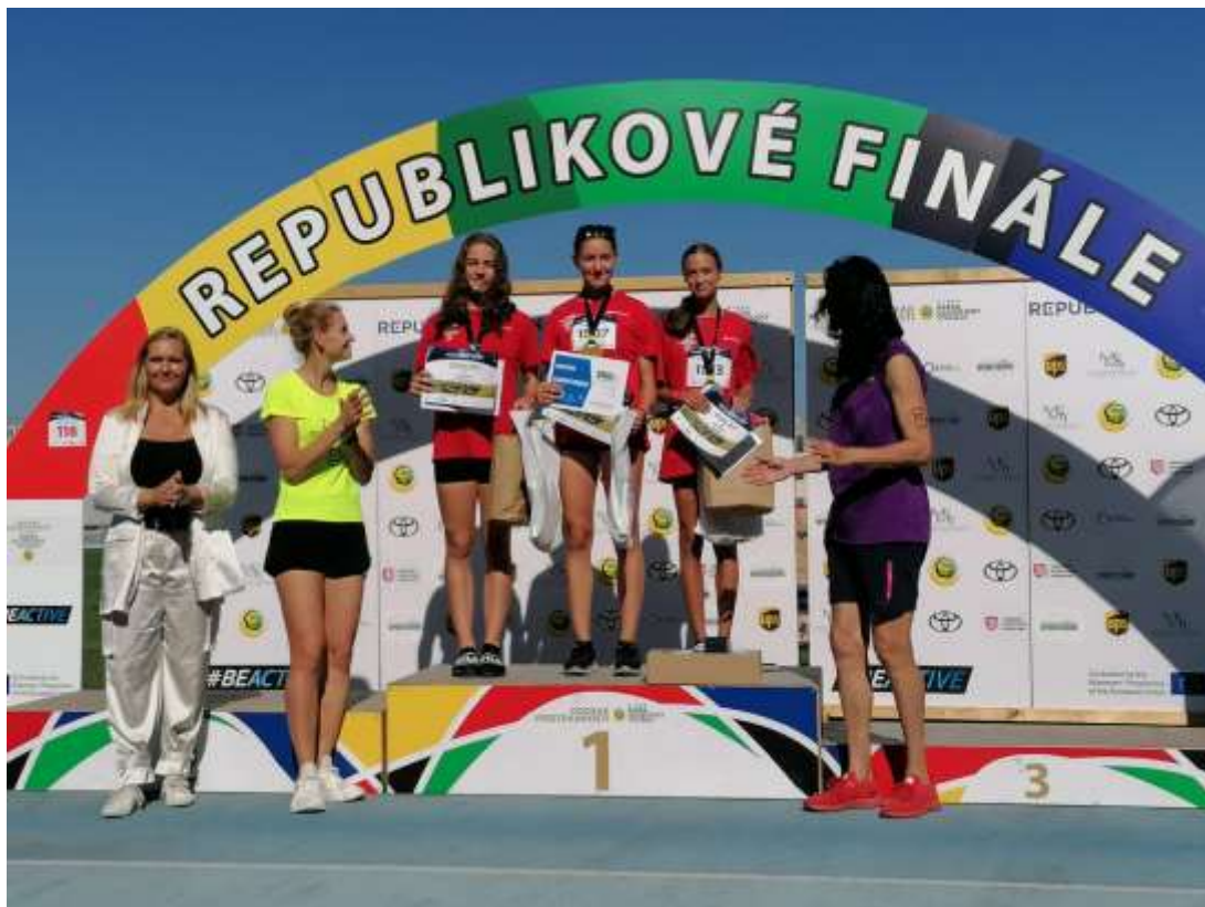
Republikové finále OVOV – Brno - září 2023