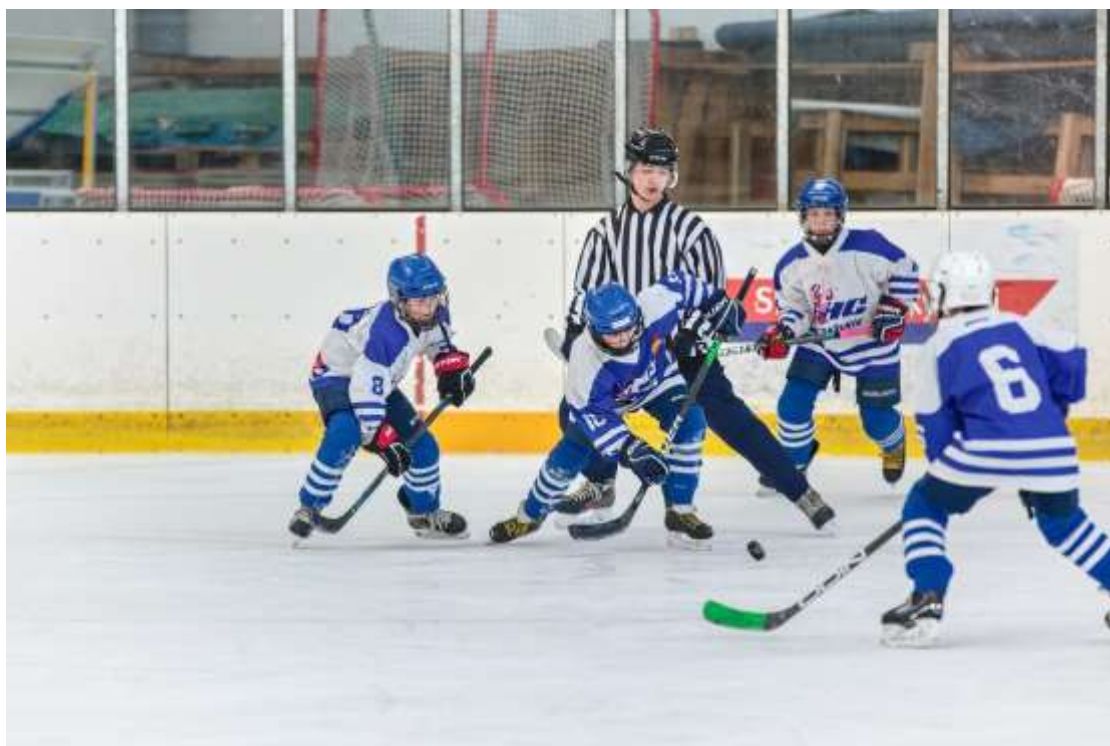
Hokejové utkání rakovnických škol – březen 2024