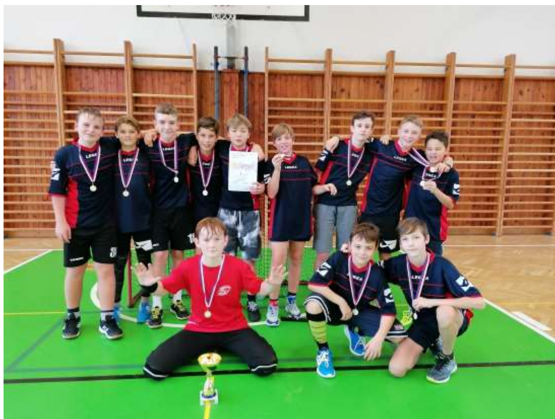
Florbal ml. žáků – 3. ZŠ Rakovník - listopad 2023