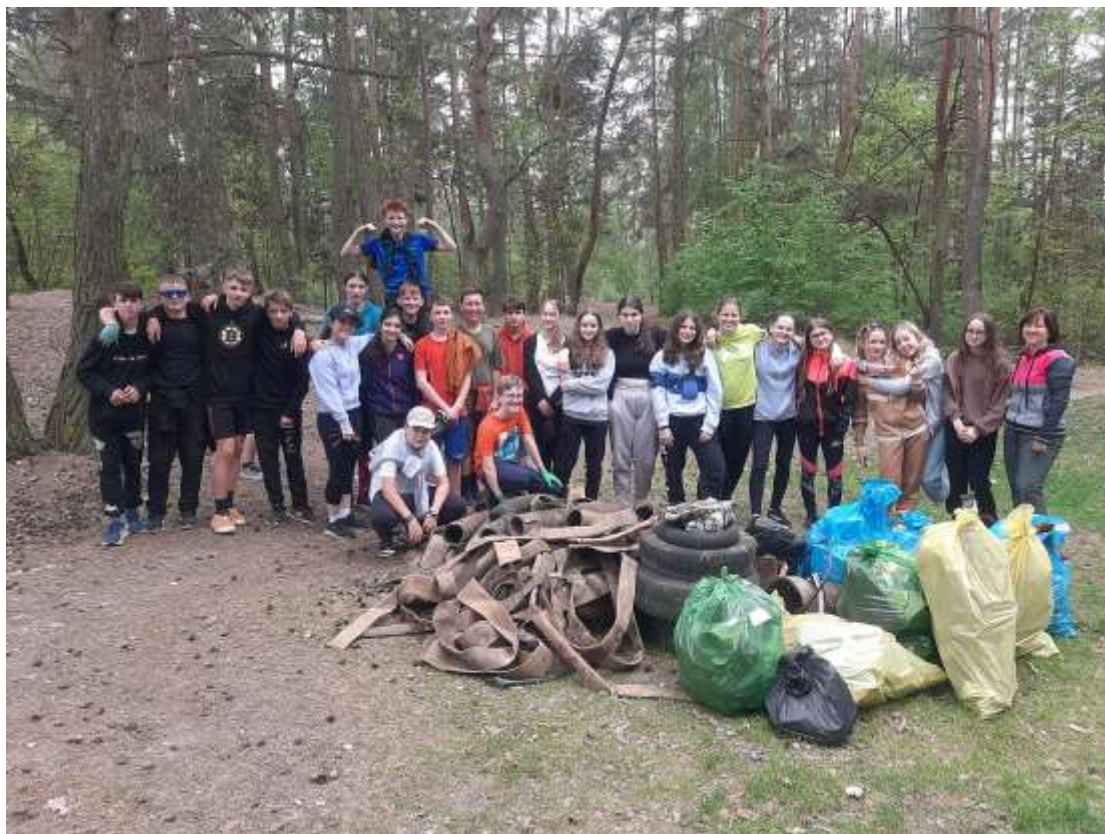
Uklidíme Česko – květen 2024 – VII. A