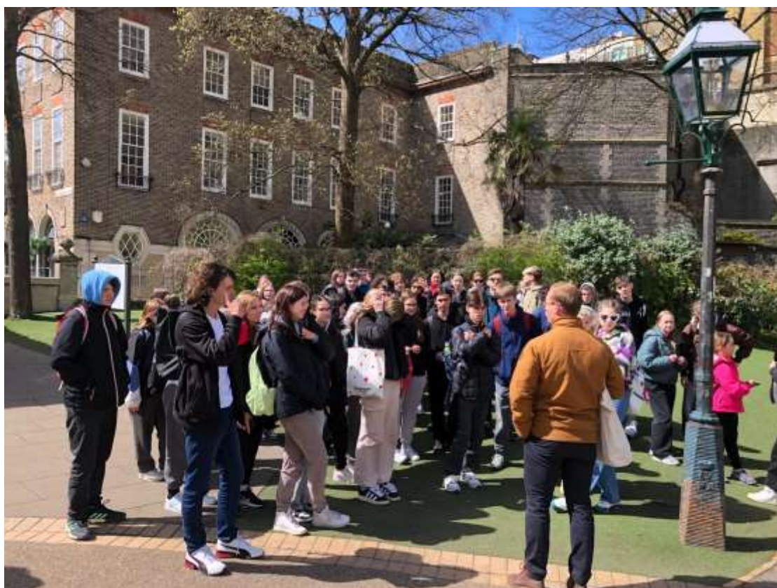
Studijní pobyt v Anglii - duben 2024