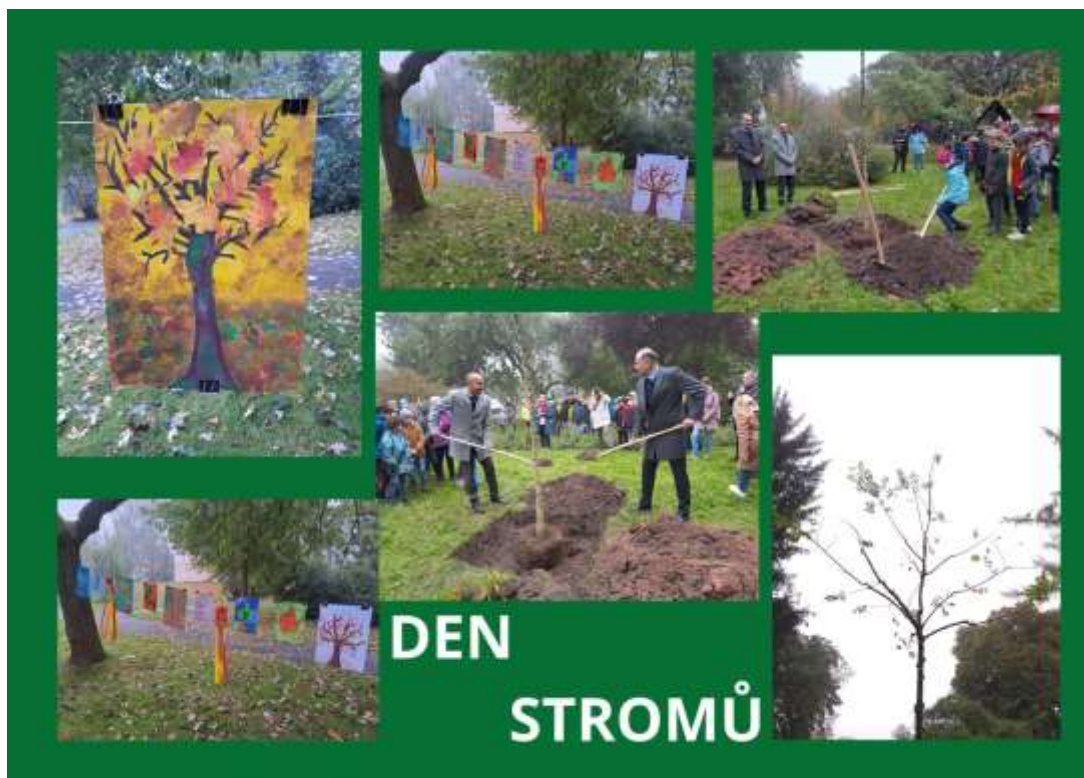
Den stromů – Čermákovy sady – 20. října 2023