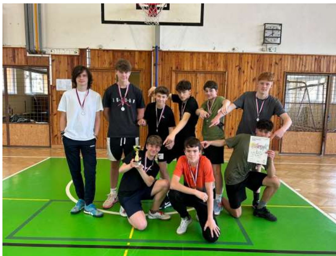
Volejbal st. žáků – 3. ZŠ Rakovník – duben 2024