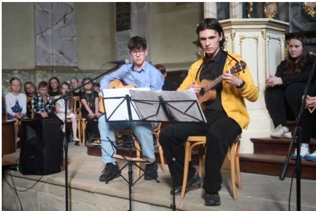
Jarní koncert v synagoze – duben 2024