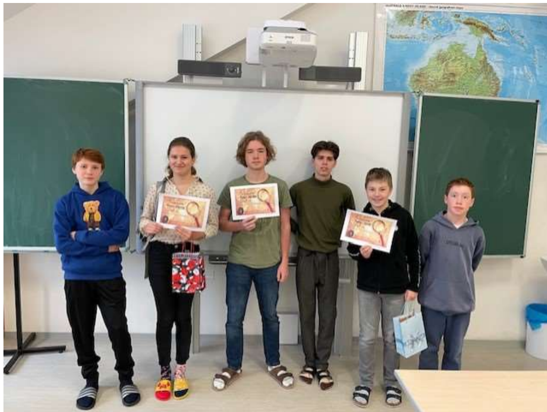
Okresní kolo zeměpisné olympiády – únor 2024