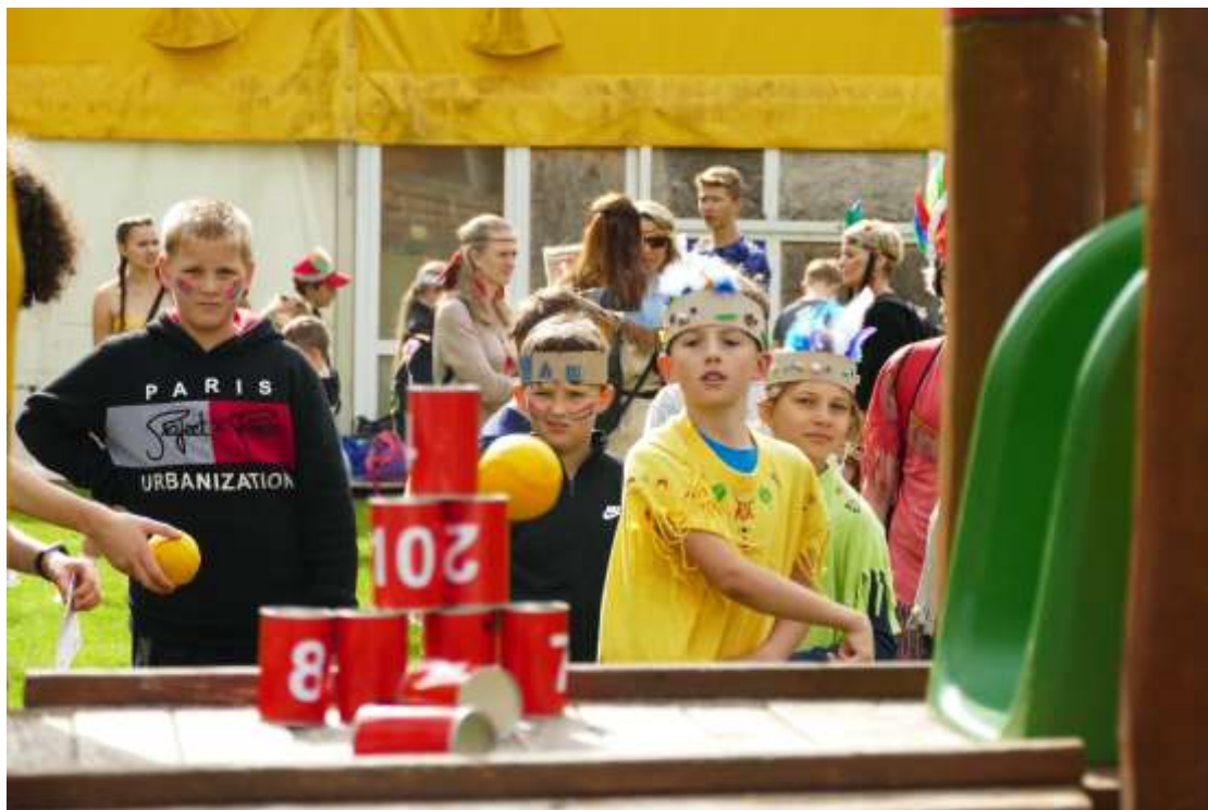
Den dětí na Tyršově koupališti – 31. 5. 2024