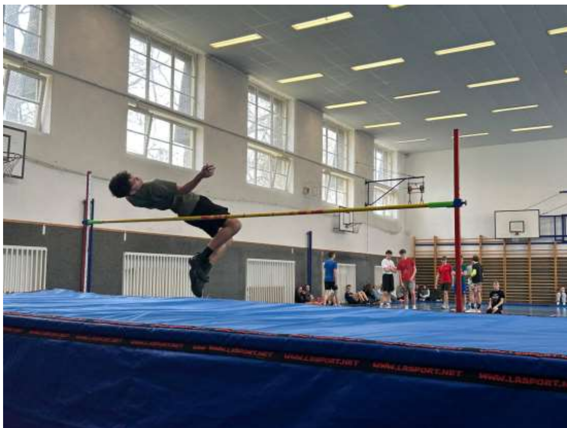
Rakovnická laťka – 2. ZŠ Rakovník – duben 2024