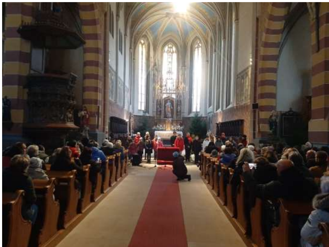
Vánoční koncert – chrám sv. Bartoloměje – 26. 12. 2023