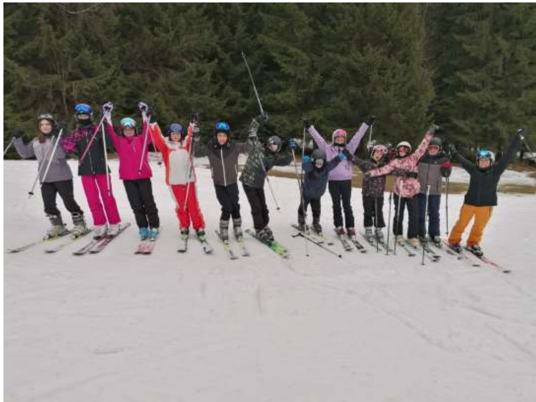
Lýžařský výcvik VII. B, C – Špičák na Šumavě – leden 2024