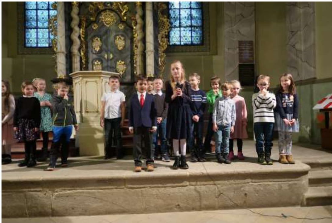
Slavnostní předání vysvědčení žákům 1. roč. - synagoga – 31. 1. 2024