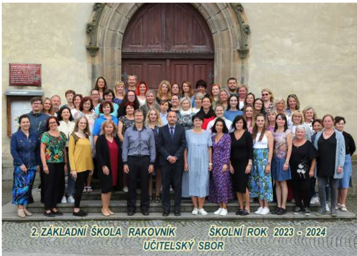
Zaměstnanci školy – 1. 9. 2023