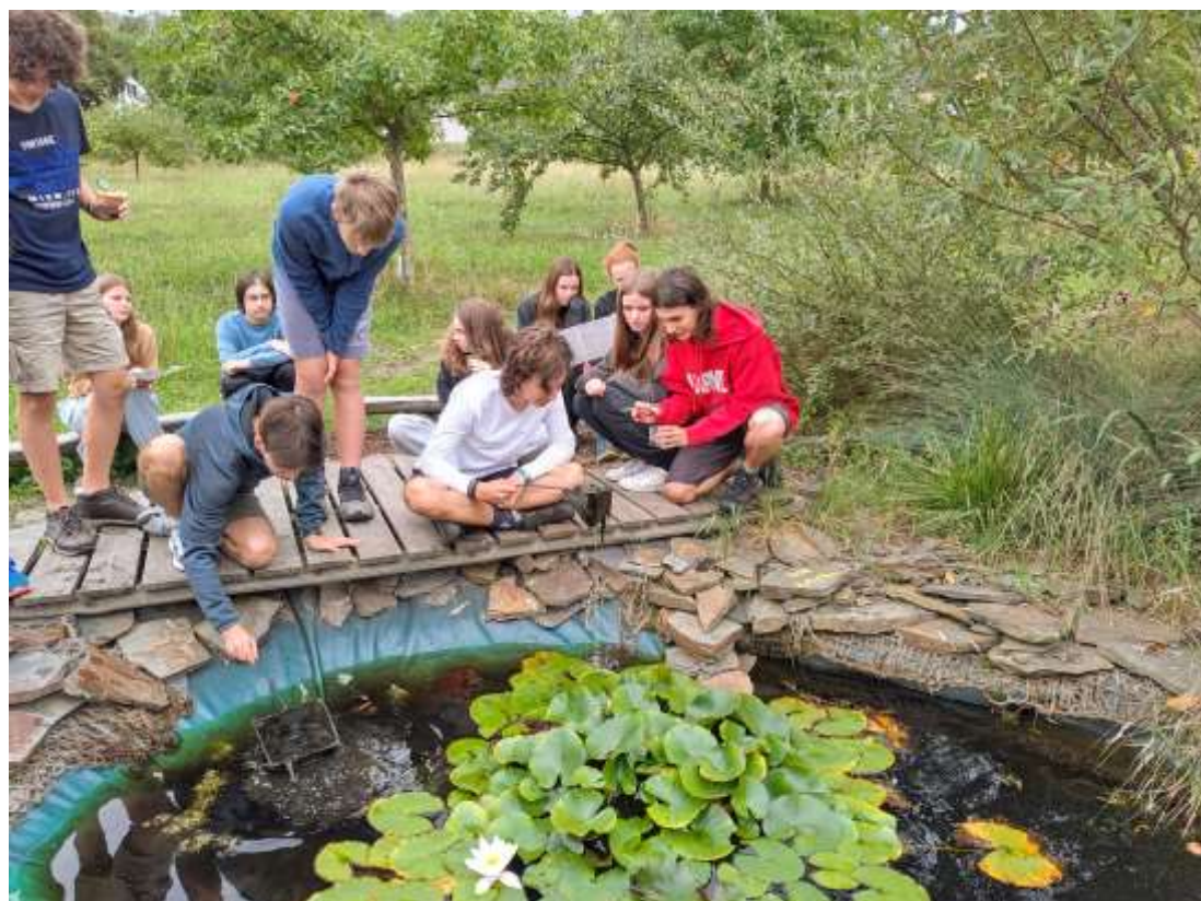
Ekologický pobyt – Čabárna - září 2023 – IX. A