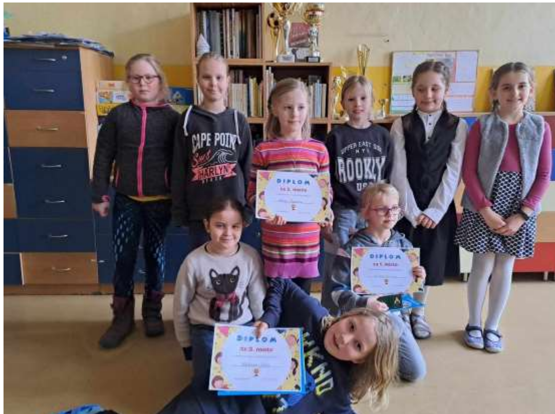
Školní kolo recitační soutěže 1. st. – únor 2024