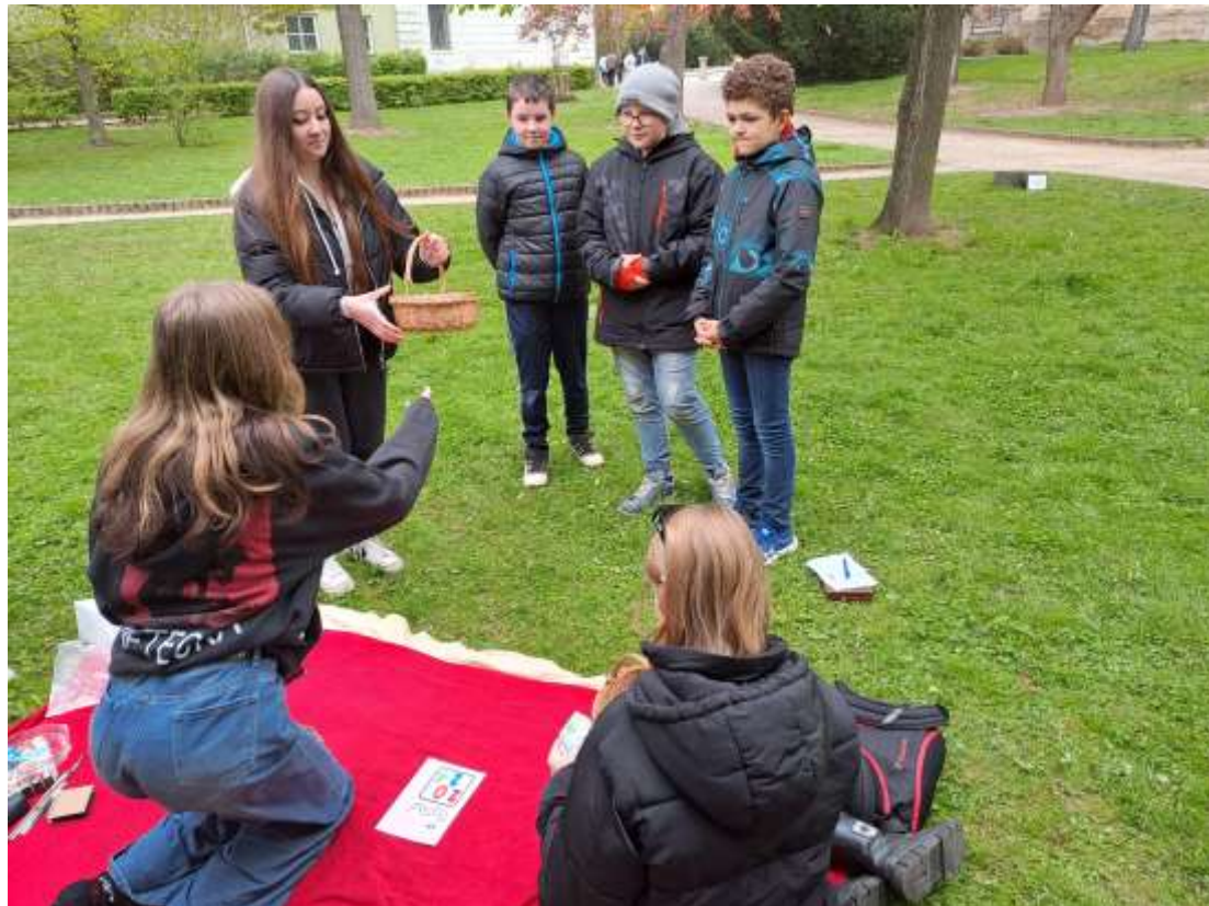
Den Země – duben 2024