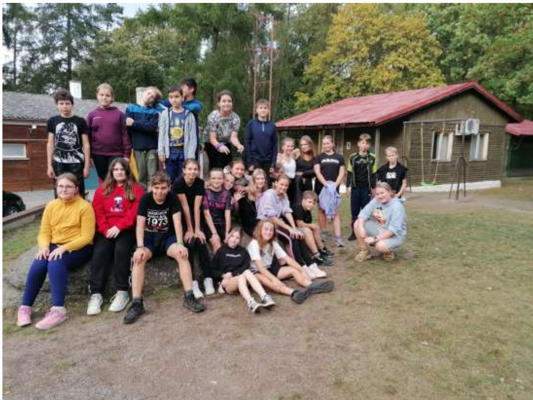
Adaptační kurz – Jesenice - září 2023 – VI. B