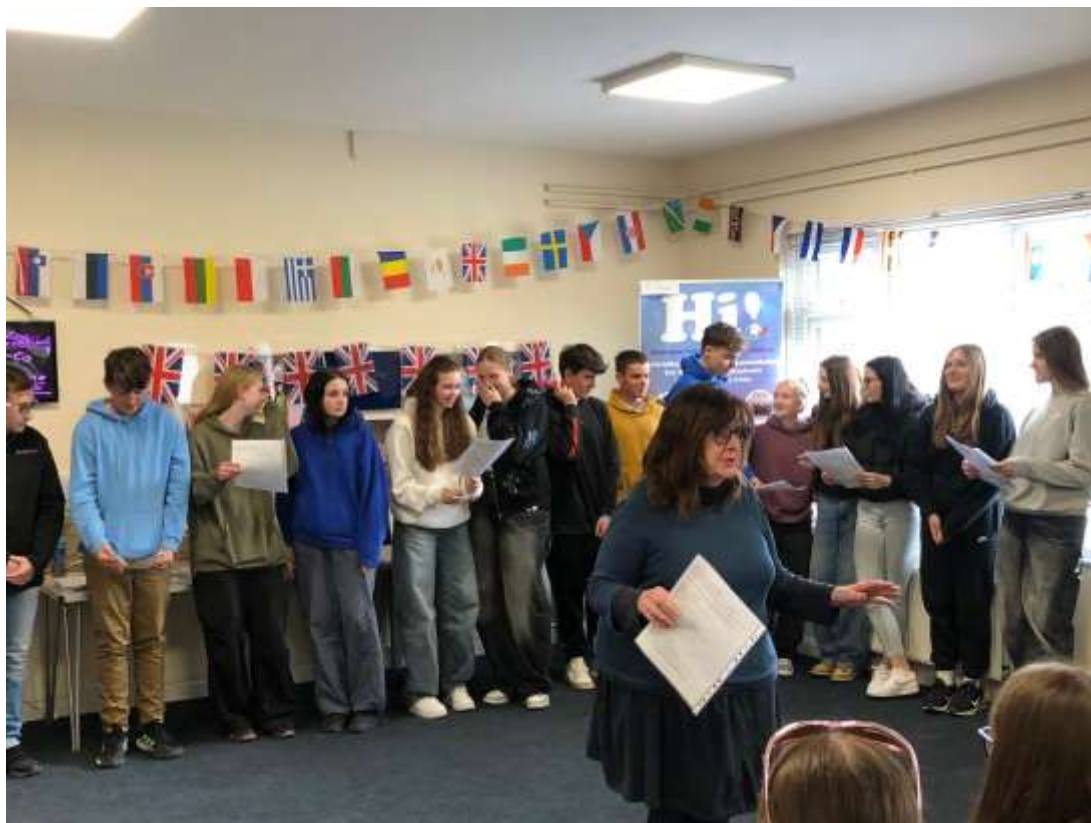
Studijní pobyt v Anglii - duben 2024