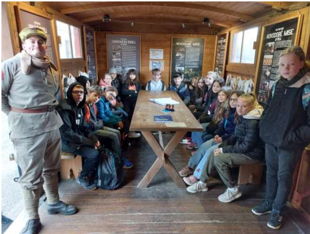
Legiovlak – vlakové nádraží Rakovník – listopad 2023 – VI. D