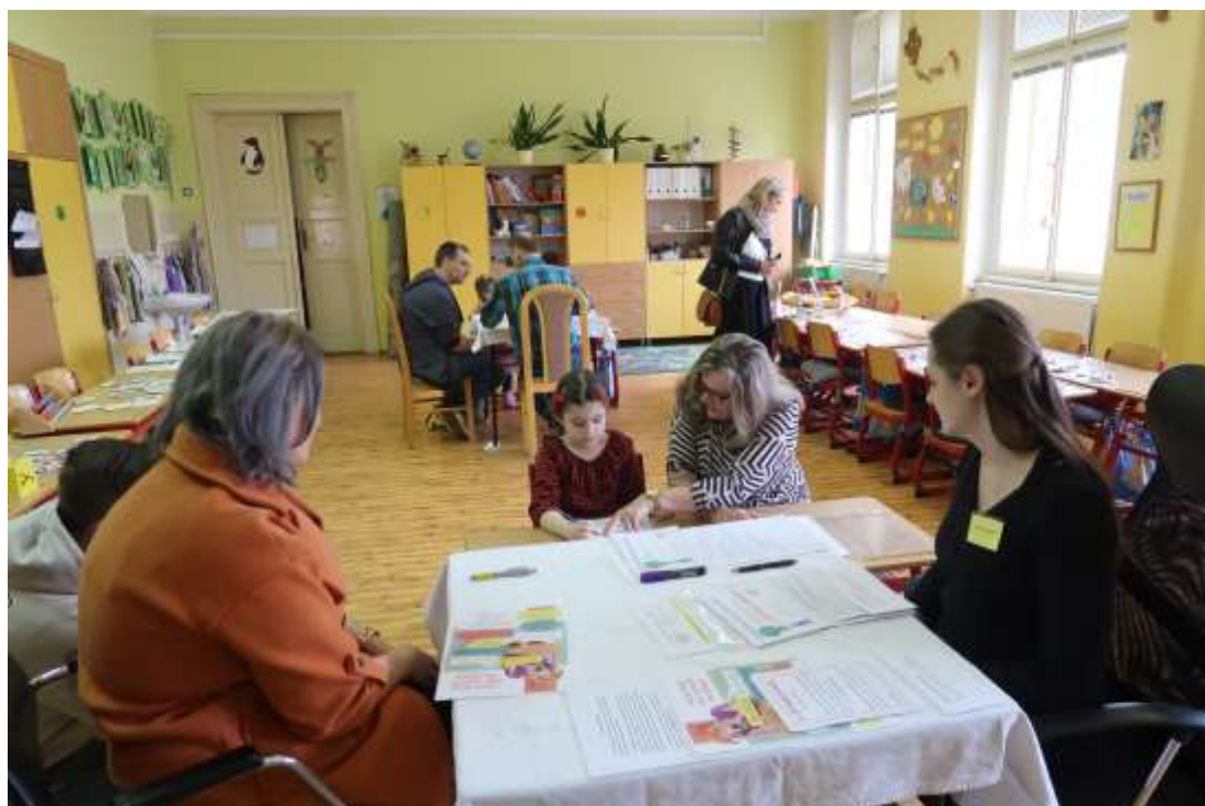
Zápis do 1. ročníku – Stará pošta – duben 2024