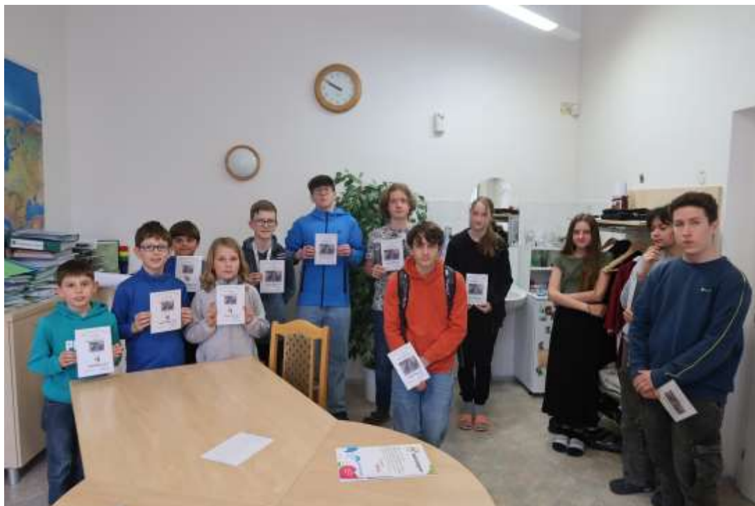
Matematický klokan – březen 2024