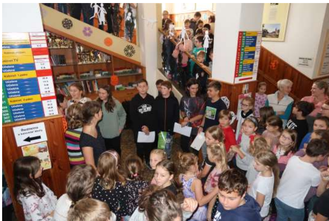
Zpívání na schodech – pěvecký sbor 2. st. - listopad 2023