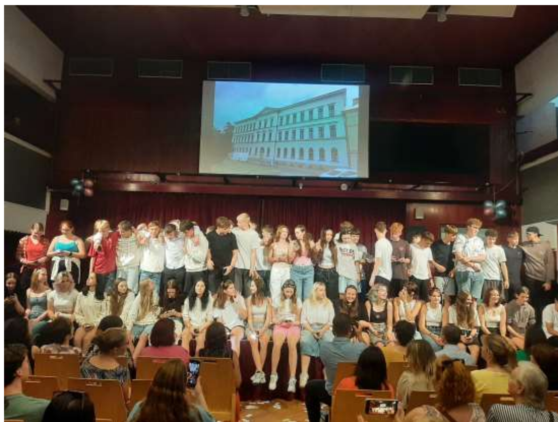
Slavnostní rozloučení žáků 9. roč. v KC Rakovník - červen 2024