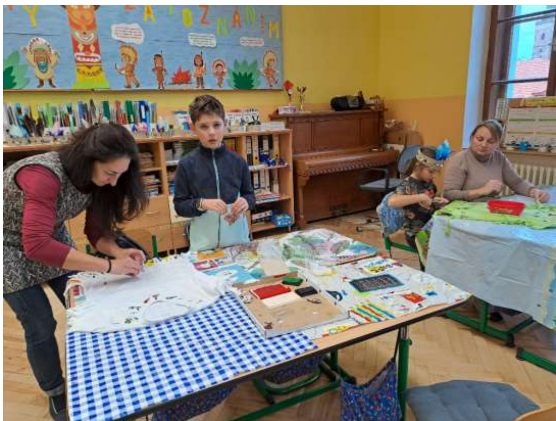
Tvoření s rodiči – indiánská trička – listopad 2023 – IV. C