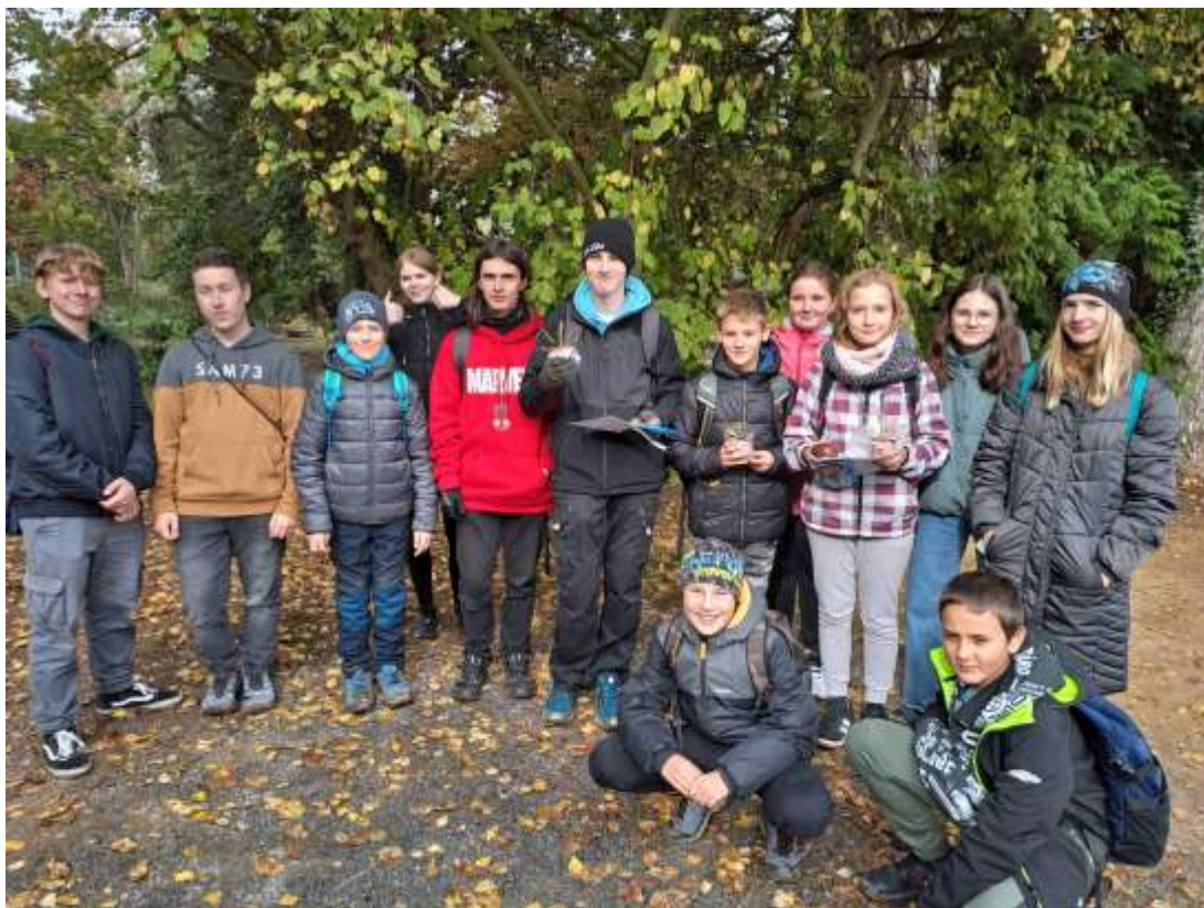
Botanická soutěž – Botanická zahrada Rakovník - říjen 2023