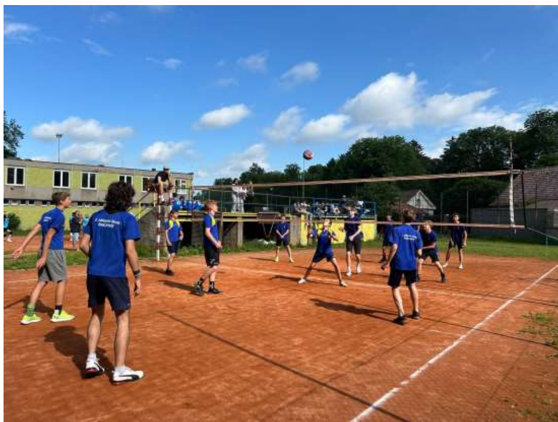
Okresní sportovní olympiáda – volejbal st. žáků – červen 2024