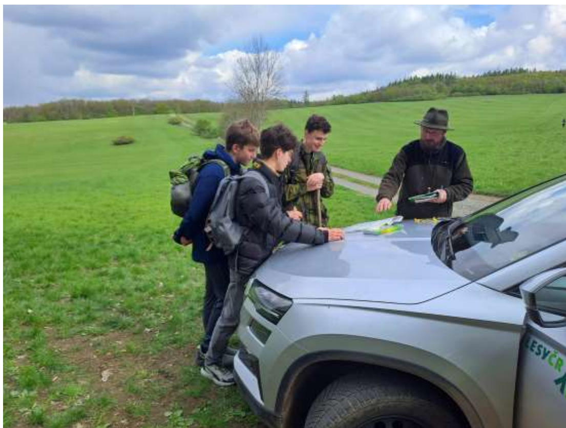
Křivoklátská sovička – duben 2024