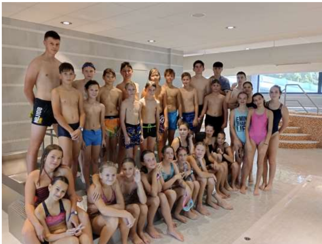
Plavecká soutěž měst – rakovnický plavecký bazén - říjen 2023