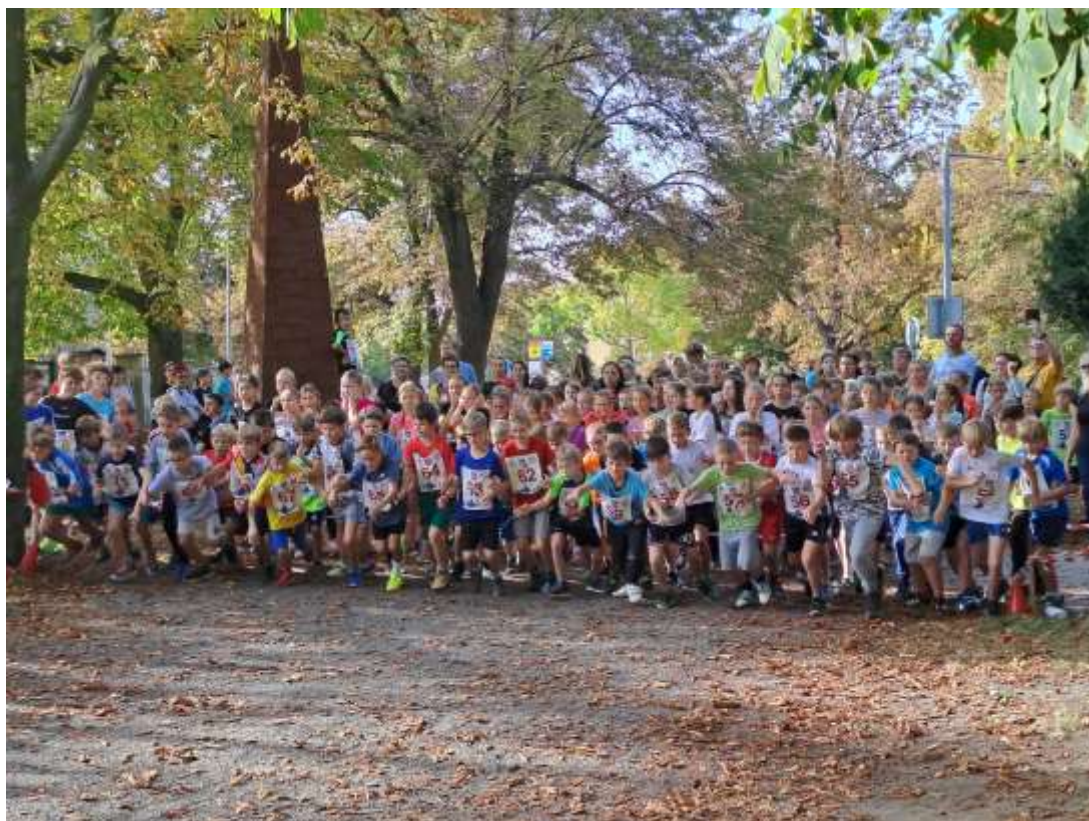
Rakovnický vytrvalec - Čermákovy sady – říjen 2023