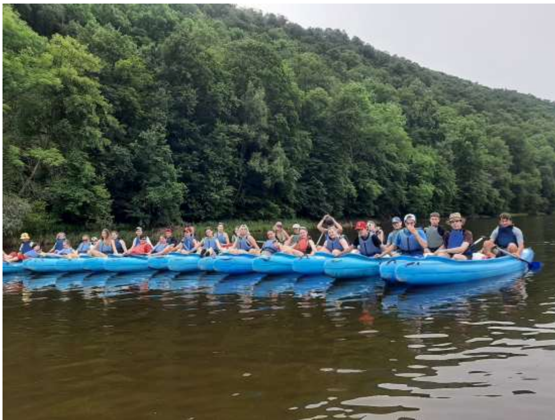
Vodácký kurz 9. roč. - červen 2024