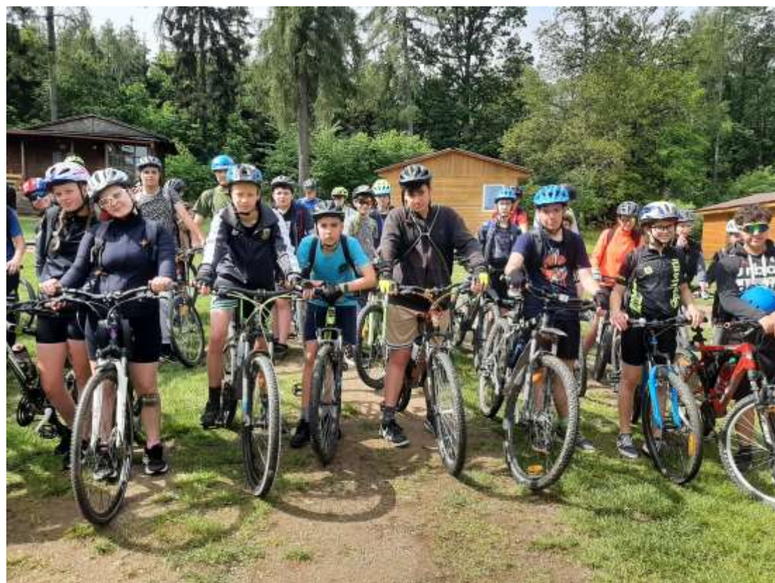
Cyklokurz 8. roč. - Jesenice - květen 2024