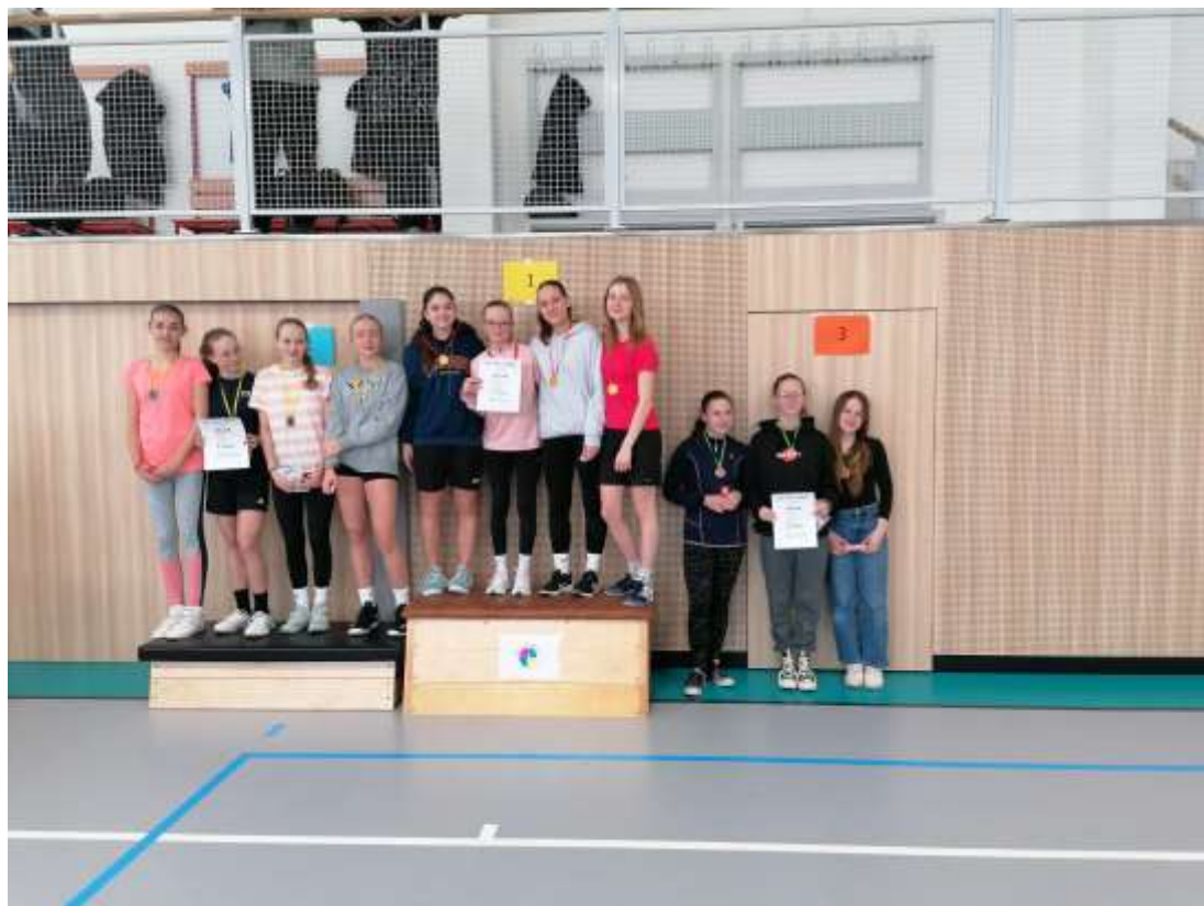
Silový čtyřboj – ZŠ Lužná – únor 2024