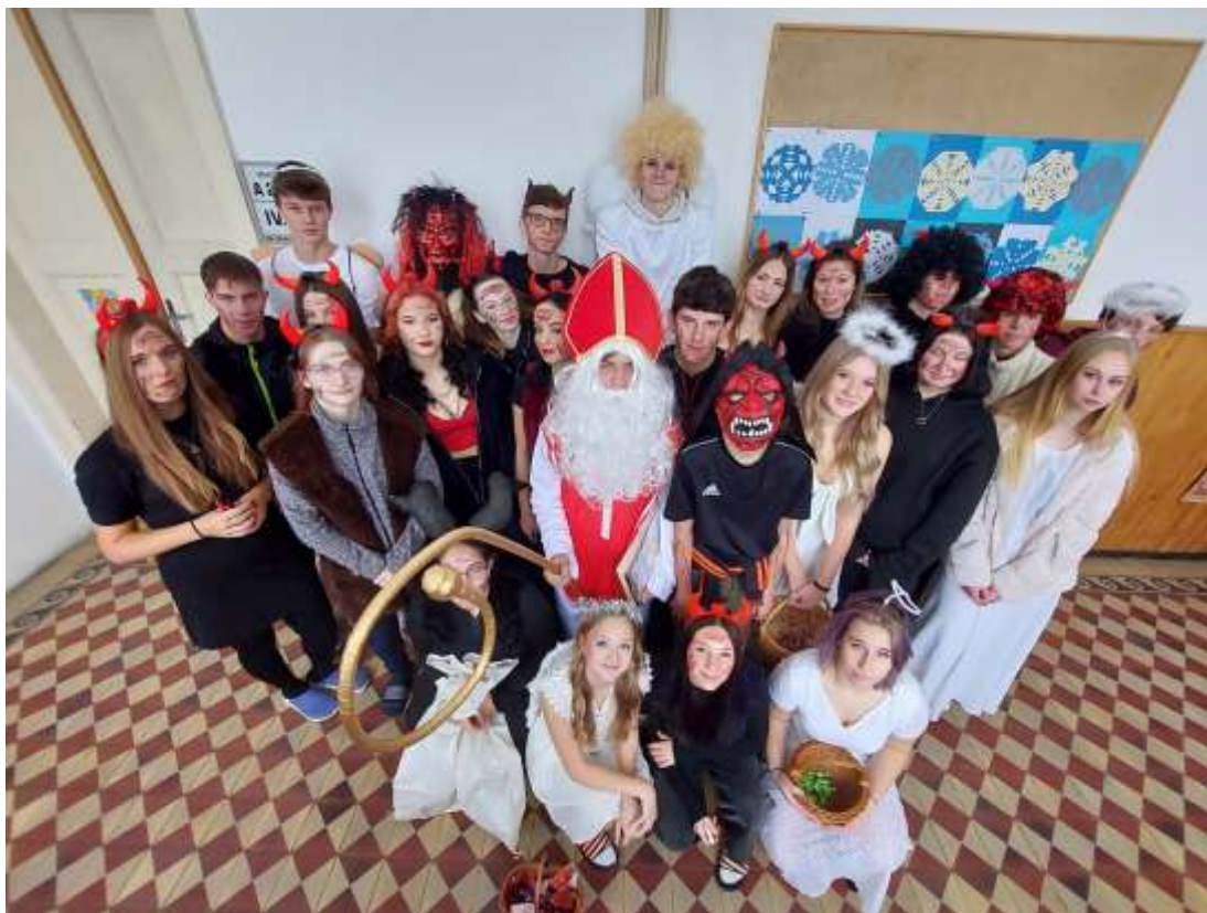
Mikulášská nadílka IX. B – prosinec 2023