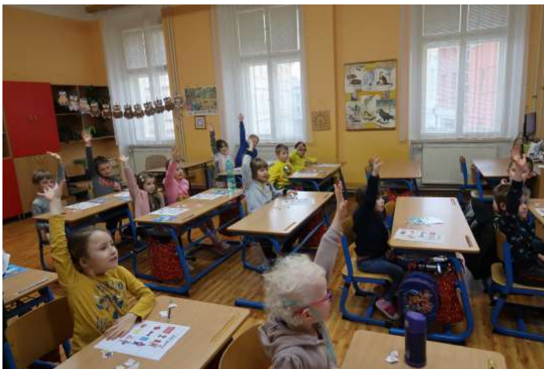
Čtyřlístek – setkání pro budoucí prvňáčky – Stará pošta - únor 2024