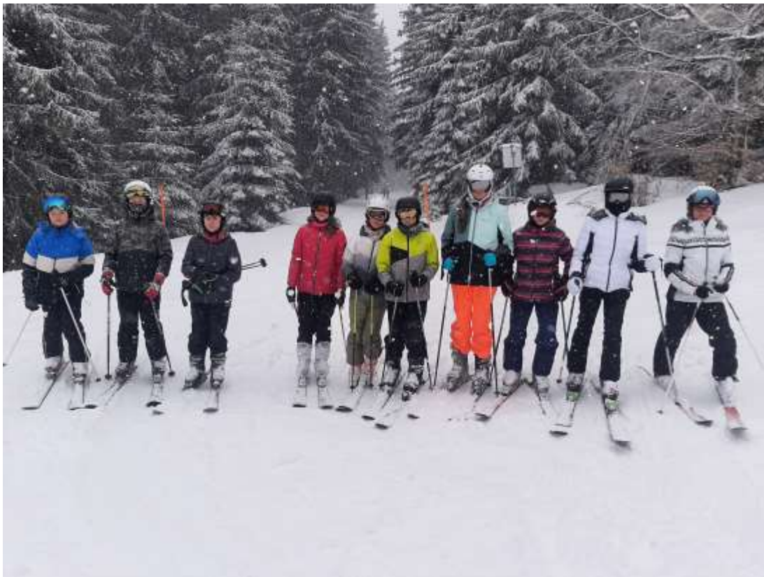
Lýžařský výcvik VII. A – Š. Mlýn – leden 2024