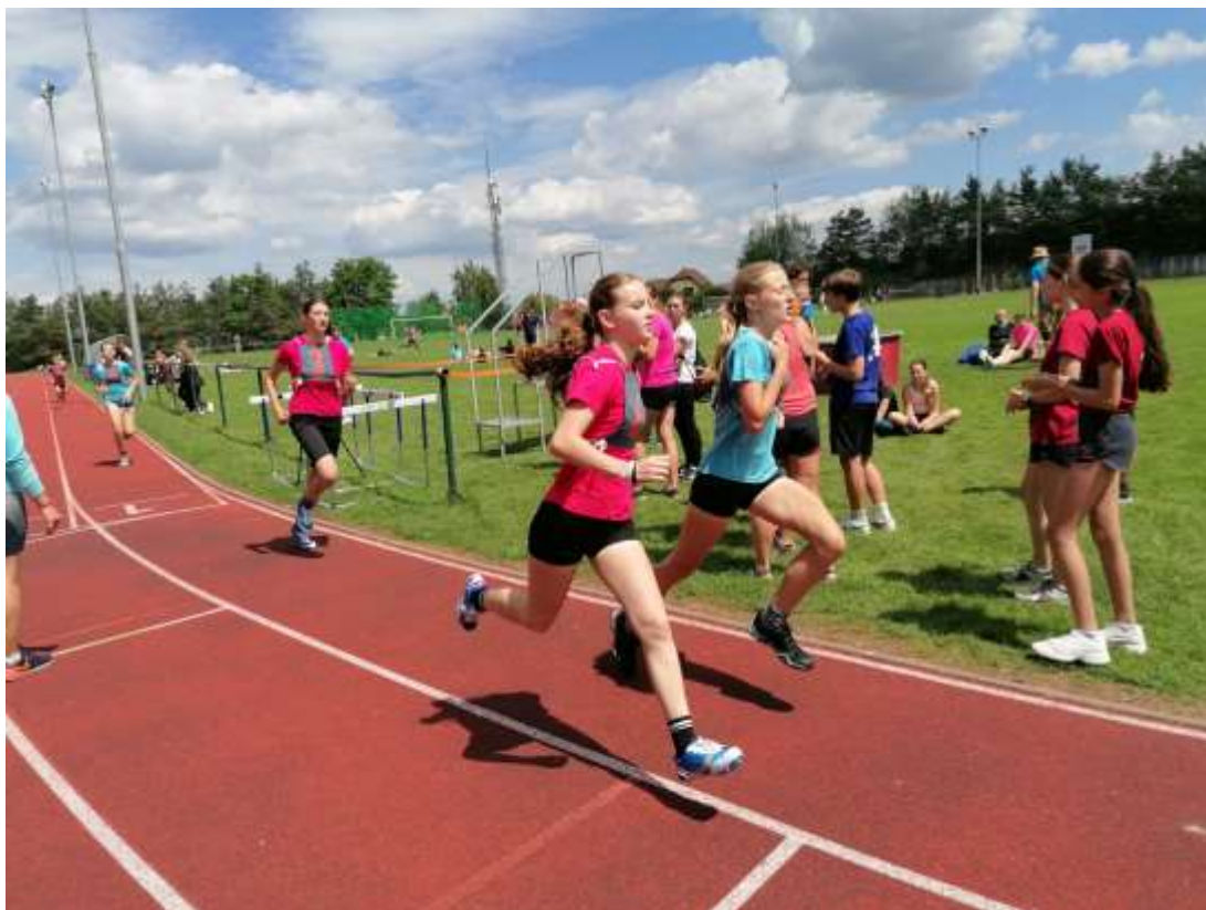
Okresní sportovní olympiáda – atletika – červen 2024