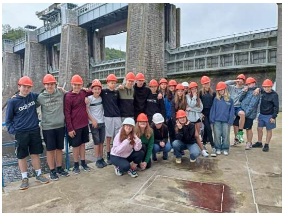
Exkurze Štěchovice – červen 2024 – VIII. B, IX. B