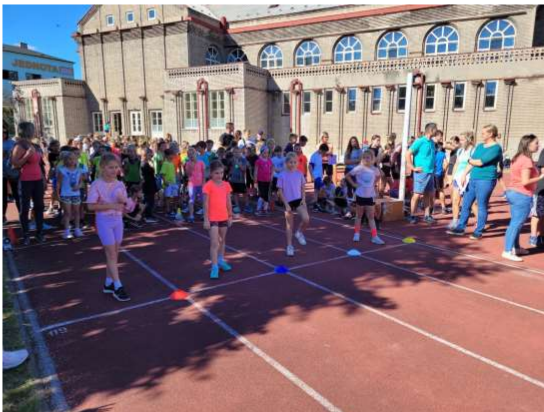
Rakovnický sprint – sokolovna - září 2023