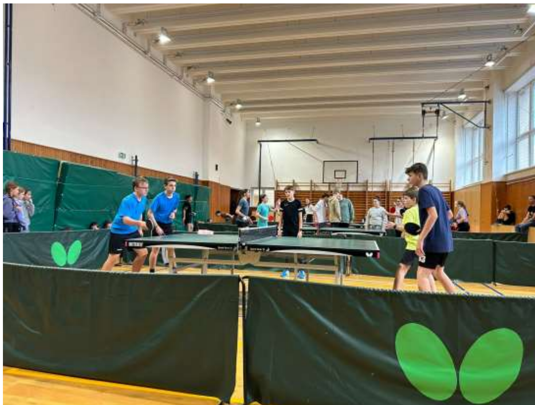
Stolní tenis – ZŠ Nové Strašecí – leden 2024