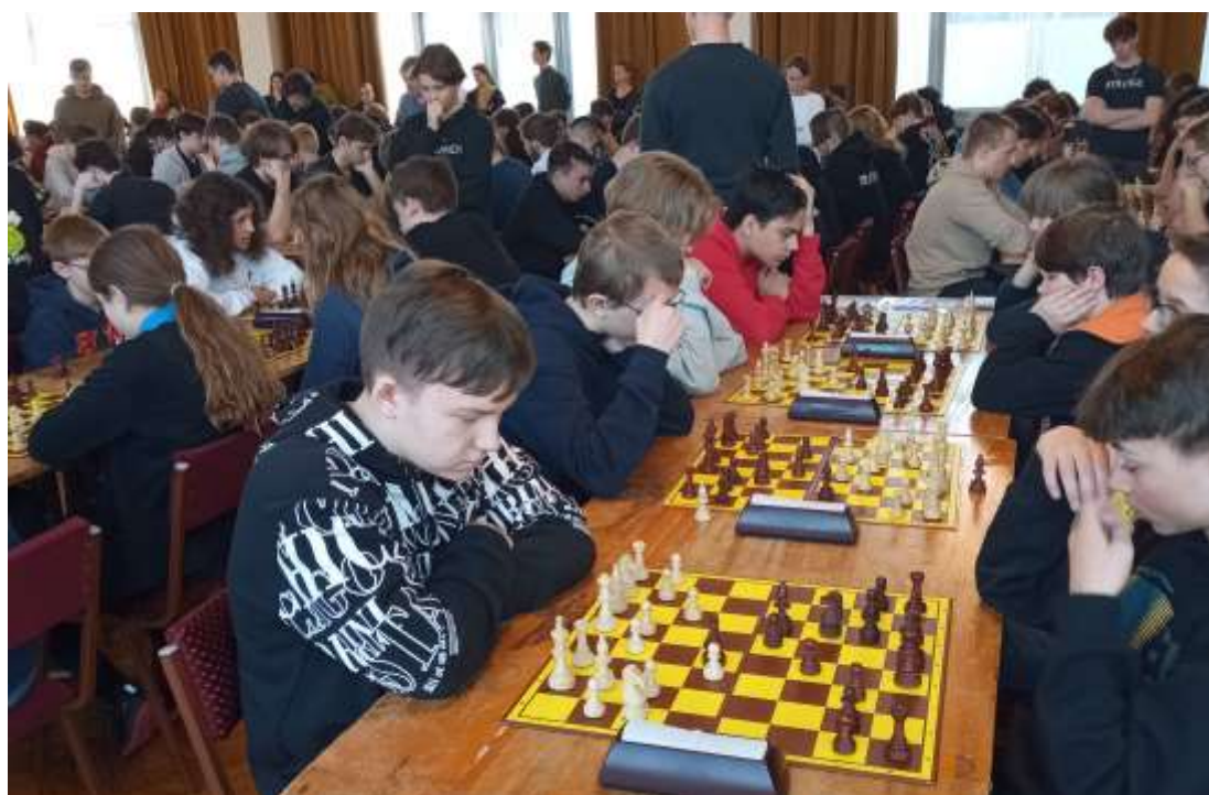
Krajské kolo turnaje v šachu - Neratovice – březen 2024